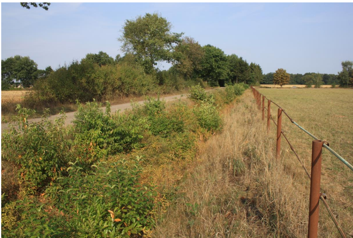
Abbildung 4-1: Saumstreifen längs des Grabens und Feldwegs im Norden des Gebiets