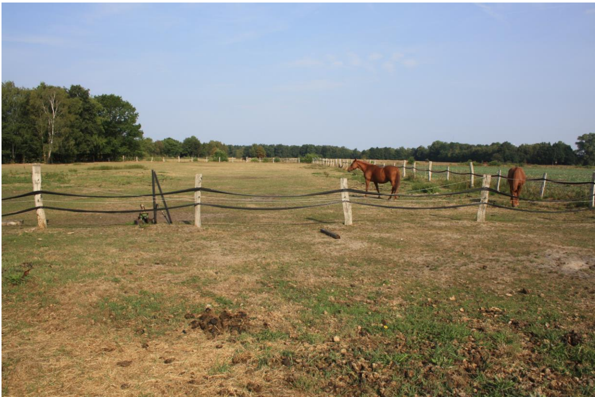
Abbildung 2-2: Mit Pferden beweidetes Grünland im östlichen Teil des Plangebietes