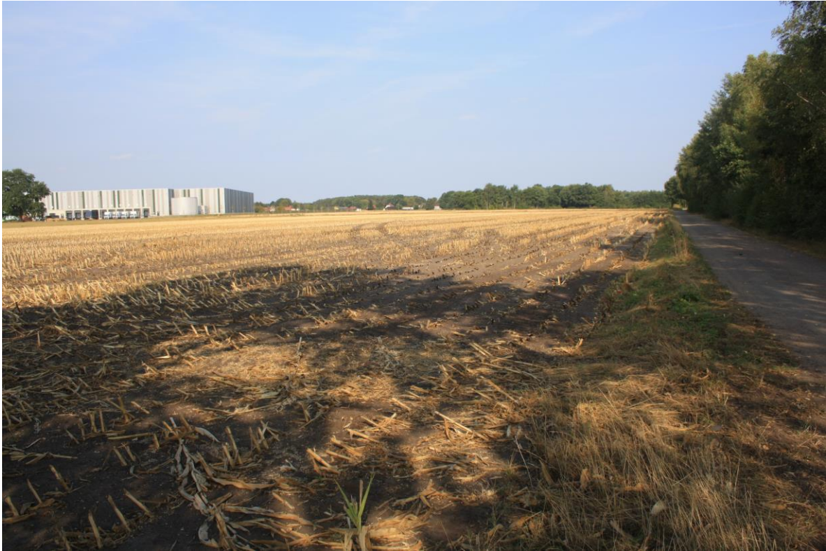
Abbildung 2-1: Blick über den nordwestlichen Teil des Plangebietes, links im Hintergrund das bestehende Gewerbegebiet