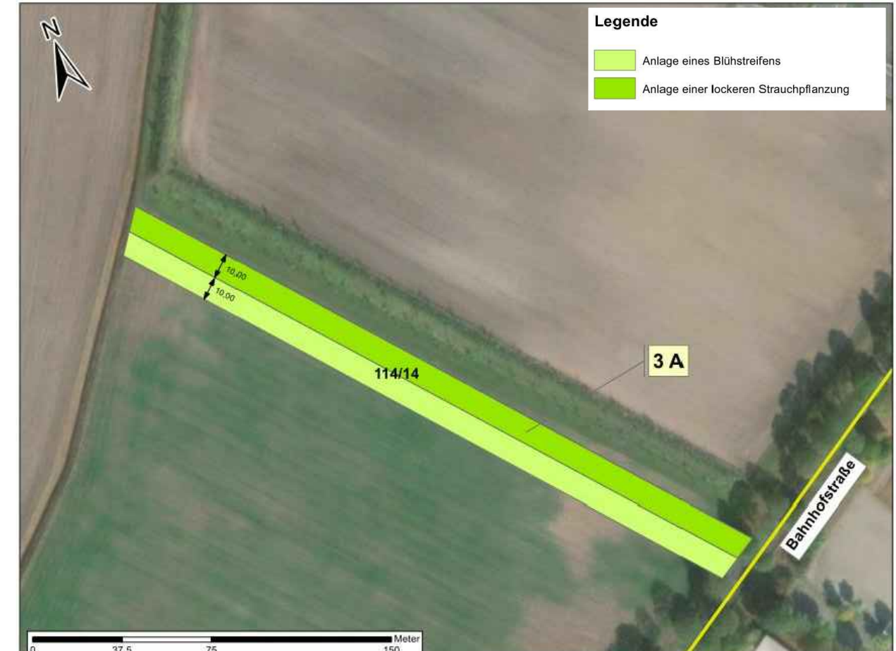
Gruppe Freiraumplanung, „Artenschutzrechtlicher Fachbeitrag Bebauungsplan Nr. 37 „Feuerwehrhaus“