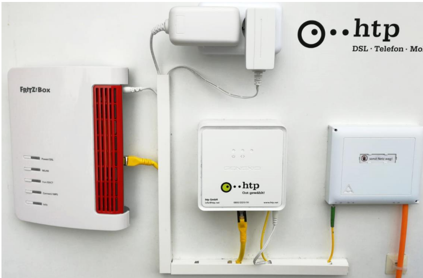
Router (z.B. Fritzbox) 230V Anschluss Medienkonverter Hausübergabepunkt (BOX) mit Glasfaserzuleitung